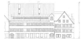
Kaiser-Max-Str. 18, VG + Kaiser-Max-Str. 16 16. Jahrhundert