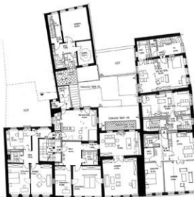
Im GRUNDRISS sind die historischen Bauparzellen erkennbar