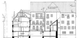
SCHNITT durch den begrünten Innenhof