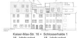
Kaiser-Max-Str. 16 + Schlosserhalde 1 16. Jahrhundert 18. Jahrhundert